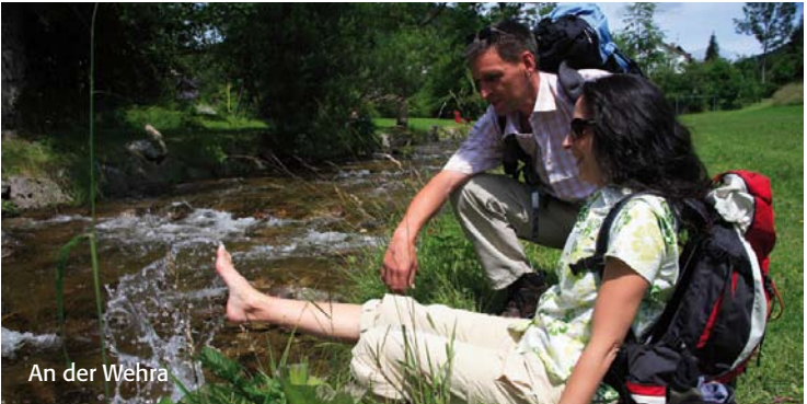
An der Wehra